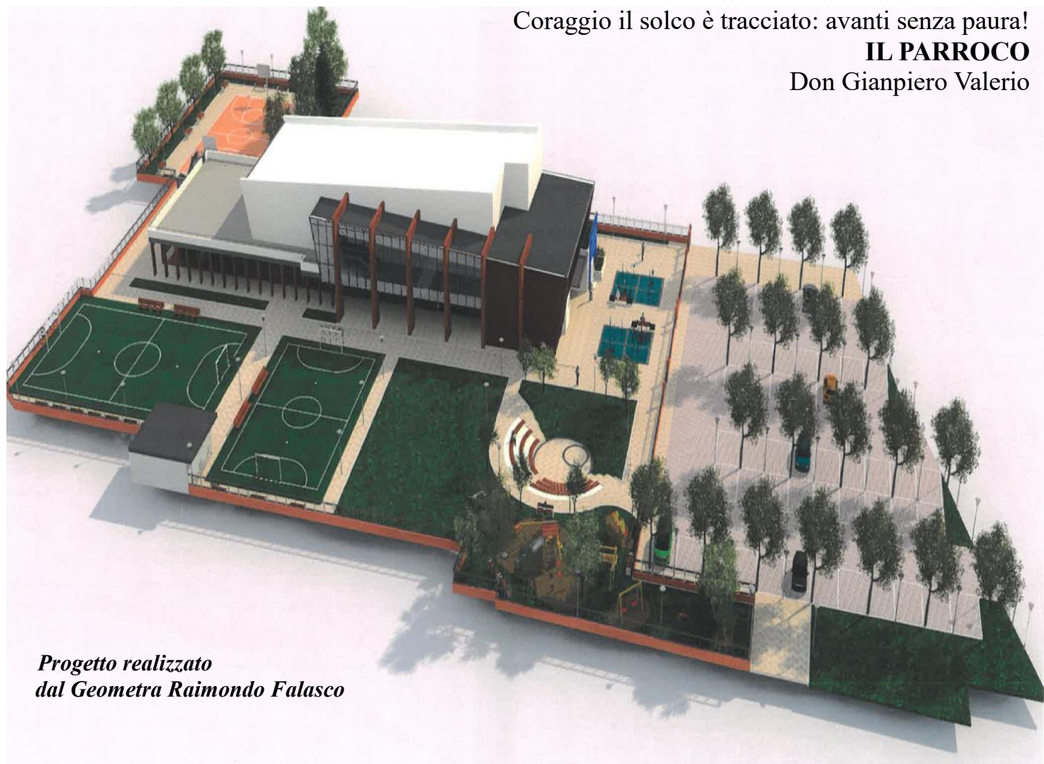
Progetto realizzato dal Geometra Raimondo Falasco

DOMENICA 2 FEBBRAIO - nel SOTTO-CHIESA della Coppina