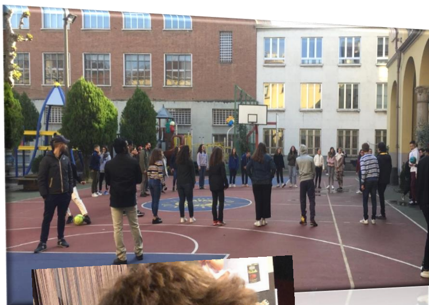
Gli animatori con tanto love

È stata un'esperienza sicuramente formativa perché ci ha insegnato molte nuove cose che potremmo sfruttare per migliorarci, ma soprattutto è stata veramente divertente e oltre agli insegnamenti pratici ha lasciato qualcosa in più nel cuore di ognuno di noi. È un ricordo difficile da dimenticare ed è un'esperienza che può aiutare nella vita quotidiana e non solo all'interno dell'oratorio. Infatti siamo tutti volenterosi di partecipare nuovamente all'animeGMS che si terrà il prossimo 28 marzo sperando di riuscire a restare anche la domenica per il GMSday, durante il quale i presenti hanno potuto assistere ad una testimonianza di alcune famiglie provenienti da un oratorio Siriano; con l'auspicio che possano venire anche coloro che questa volta non ce l'hanno fatta.