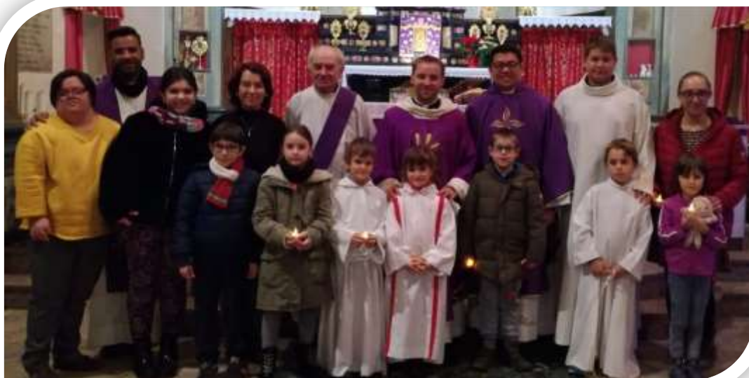
Novena delle Classi Elementari