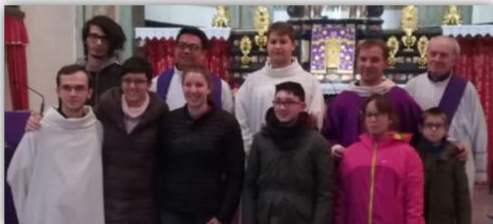
Novena del Gruppo Medie