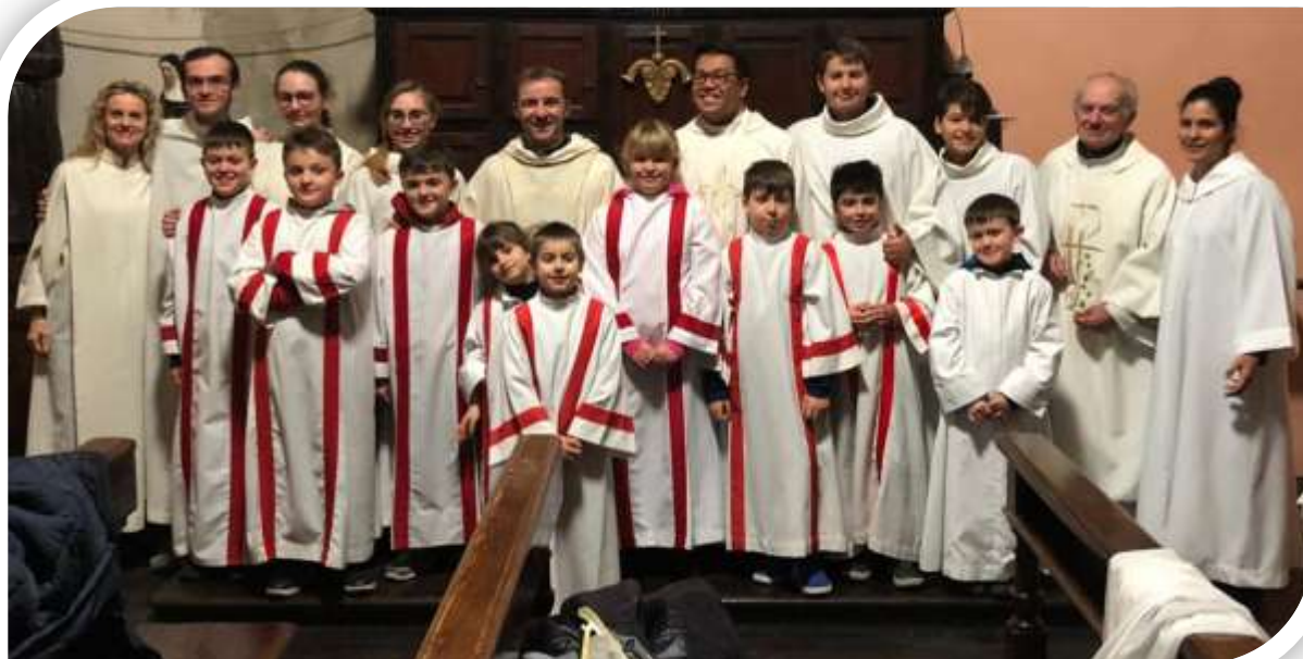
MESSA di MEZZA NOTTE