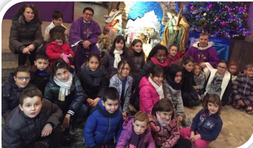
Messa di Natale degli STUDENTI